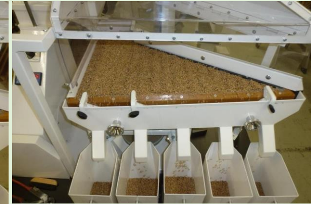
Чешуйчатая дека заполняется пшеницей во время теста

За дополнительной технической информацией, пожалуйста обращайтесь к нам напрямую.