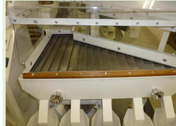
Чешуйчатая дека готова к тесту